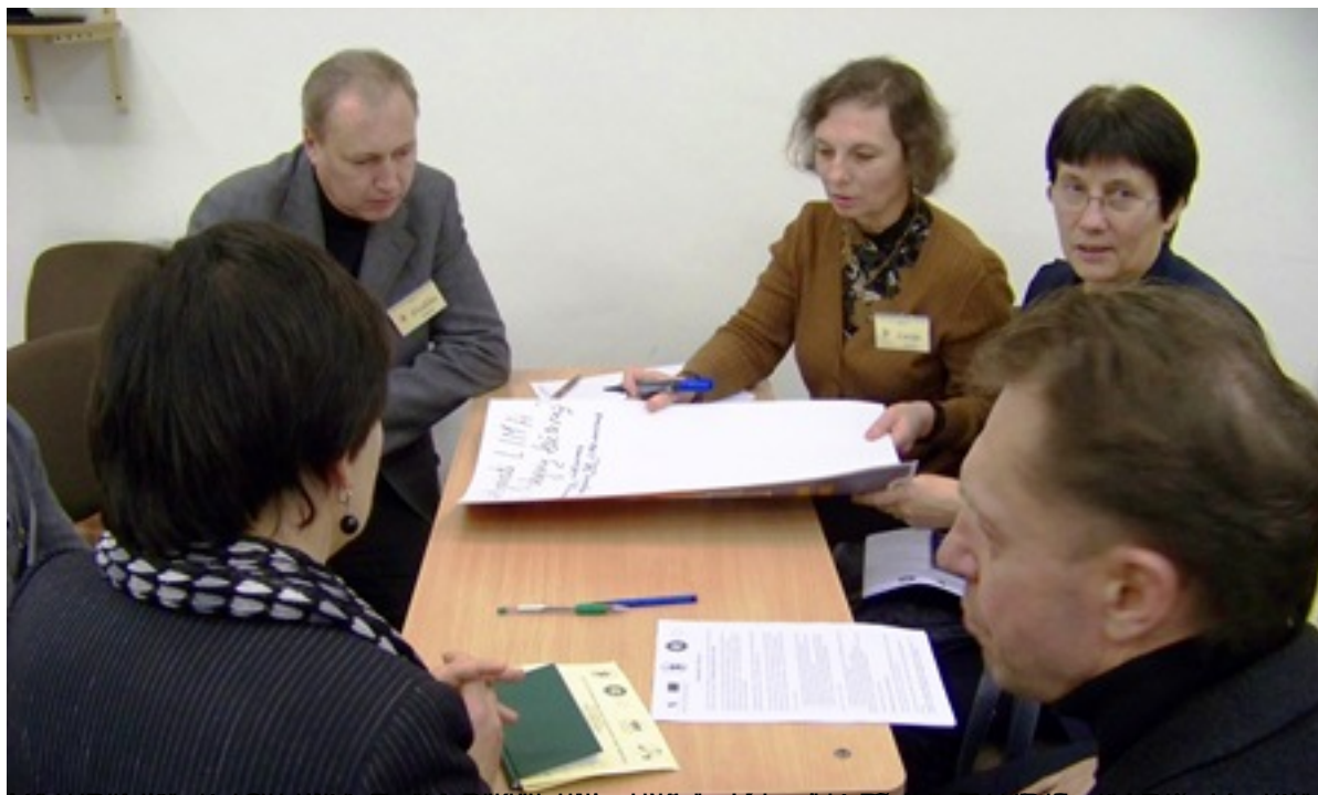
Renginio programos žinykai galerijoje